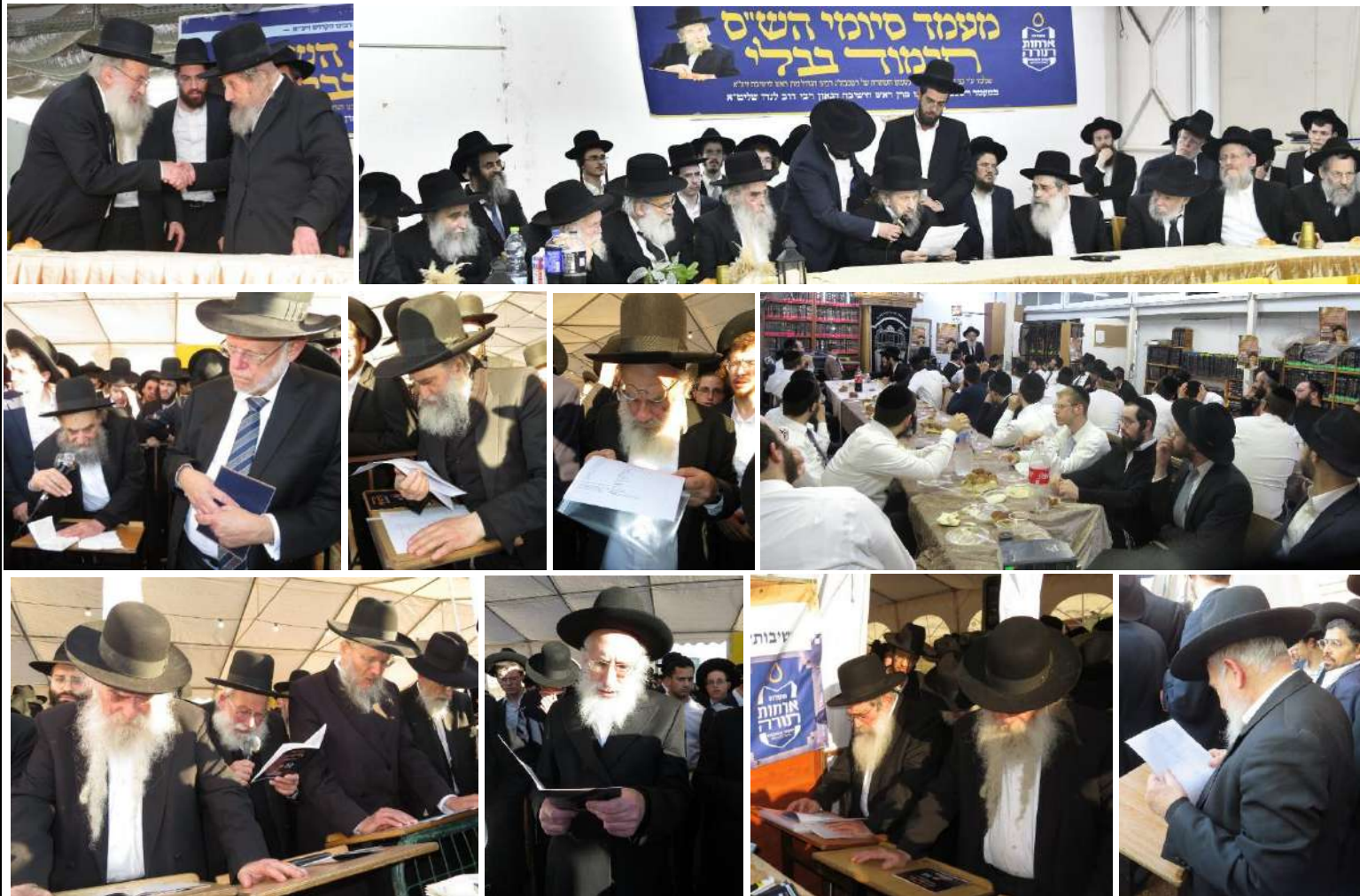
מנא מנהיג הדור מרן ראש הישיבה הגר"ד לנדו שליט"א

ממשאות הזכרון ממרנן ורבנן גדולי ישראל בראשם מנהיג הדור מרן הגר"ד לנדו שליט"א ביום היארציט